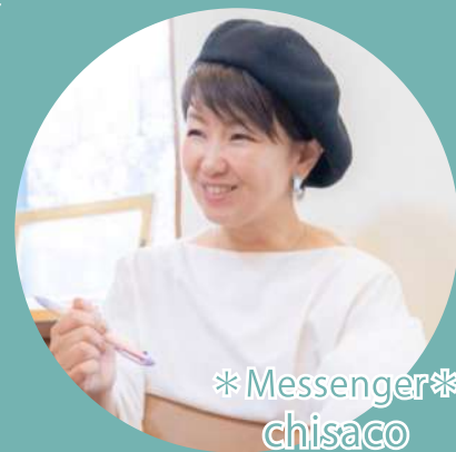
* Messenger* chisaco

お申し込み お電話にてお願い致します。 [TEL] (0532)-62-5354