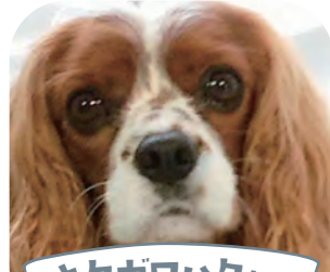
キタガワウちゃん